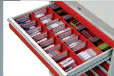
Beispielhafte Bestückung des SARA GO 1.0